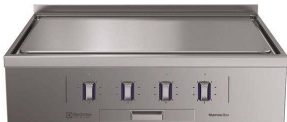
588502 (MBLCBBHOAO) Tuttapiastro elettrico top, 4 zone, con alzatina posteriore - 1 lato operatore